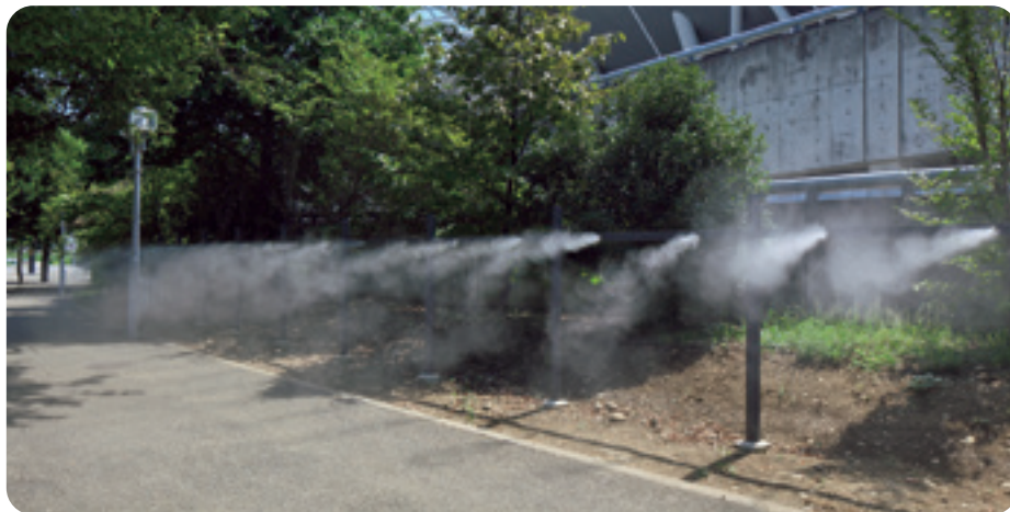
ドライ型ミストによる暑さ対策（東京スタジアム）

■ 都営バスに燃料電池バスを率先して導入することで普及促進を図るとともに、民間事業者等に対して電気自動車などの次世代自動車の導入を支援する。